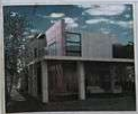
PROYECTO BÁSICO DE 4 VIVIENDAS UNIFAMILIARES AISLADAS

Autor: [Nombre del Arquitecto] Escala: 1/50 (en la escala original) Vivienda Tipo: B (Superficie y Costo) Fecha: [Fecha] Lugar: [Lugar]